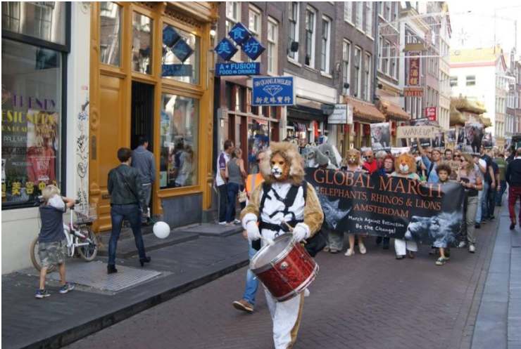
De mede door De Neushoornstichting georganiseerde Global March